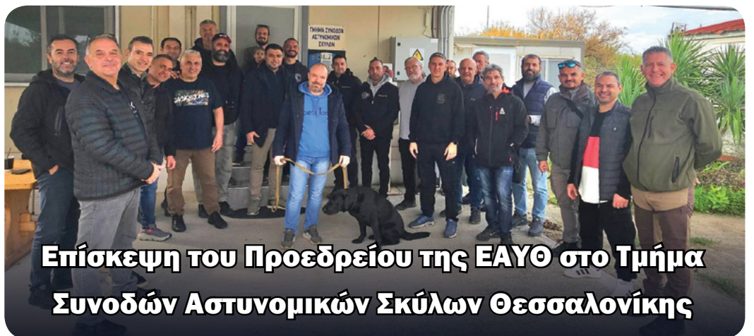
Επίσκεψη του Προεδρείου της ΕΑΥΘ στο Τμήμα Συνοδών Αστυνομικών Σκύλων Θεσσαλονίκης

Μνήμη, θυσία και συγκίνηση στην Πλατεία Συντριβανίου