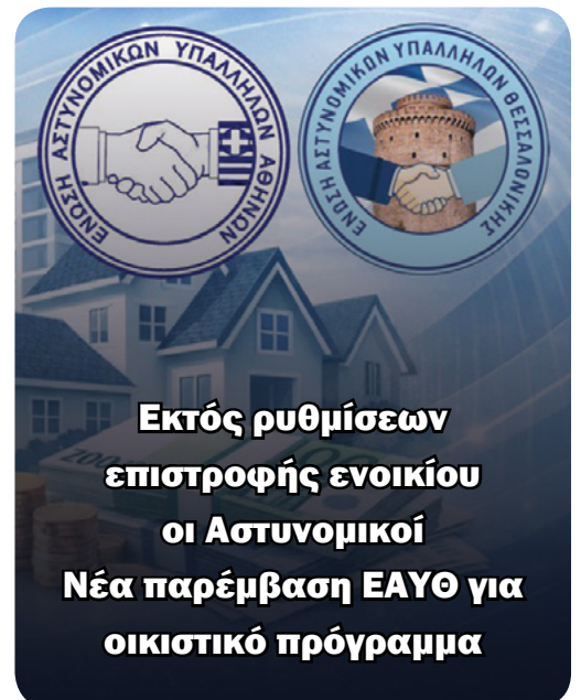
Εκτός ρυθμίσεων επιστροφής ενοικίου οι Αστυνομικοί Νέα παρέμβαση ΕΑΥΘ για οικιστικό πρόγραμμα