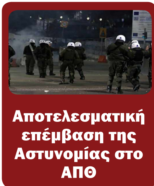
Αποτελεσματική επέμβαση της Αστυνομίας στο ΑΠΘ