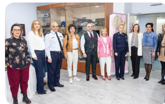
η πρόληψη του καρκίνου του μαστού, καθώς και οι ανασταλτικοί παράγοντες πρόληψης, προκαλώντας έντονο ενδιαφέρον

Η συμμετοχή των μελών της ΕΑΥΘ ήταν ιδιαίτερα θερμή, ενώ η ομιλία συνέβαλε ουσιαστικά στην ενημέρωση και ευαισθητοποίηση γύρω από τη σημασία της πρόληψης του καρκίνου του μαστού. Κατά τη διάρκεια της εκδήλωσης παρουσιάστηκαν θέματα όπως η διατροφή και